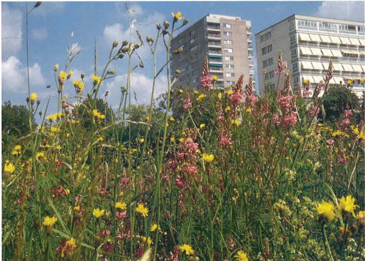
Biotop Am Stausee